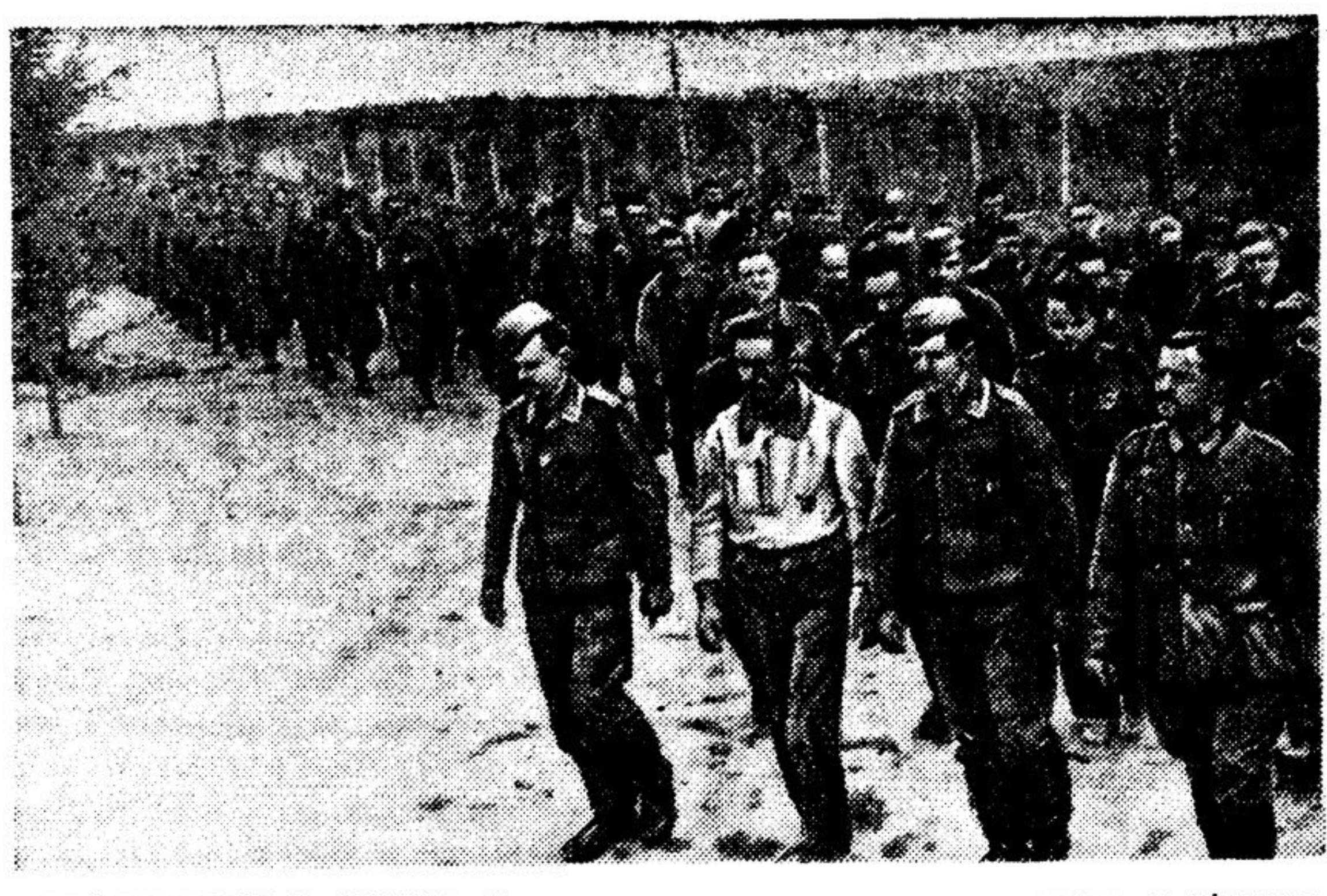
ДЕЙСТВУЮЩАЯ АРМИЯ. На снимке: полные немецкие солдаты и офицеры.