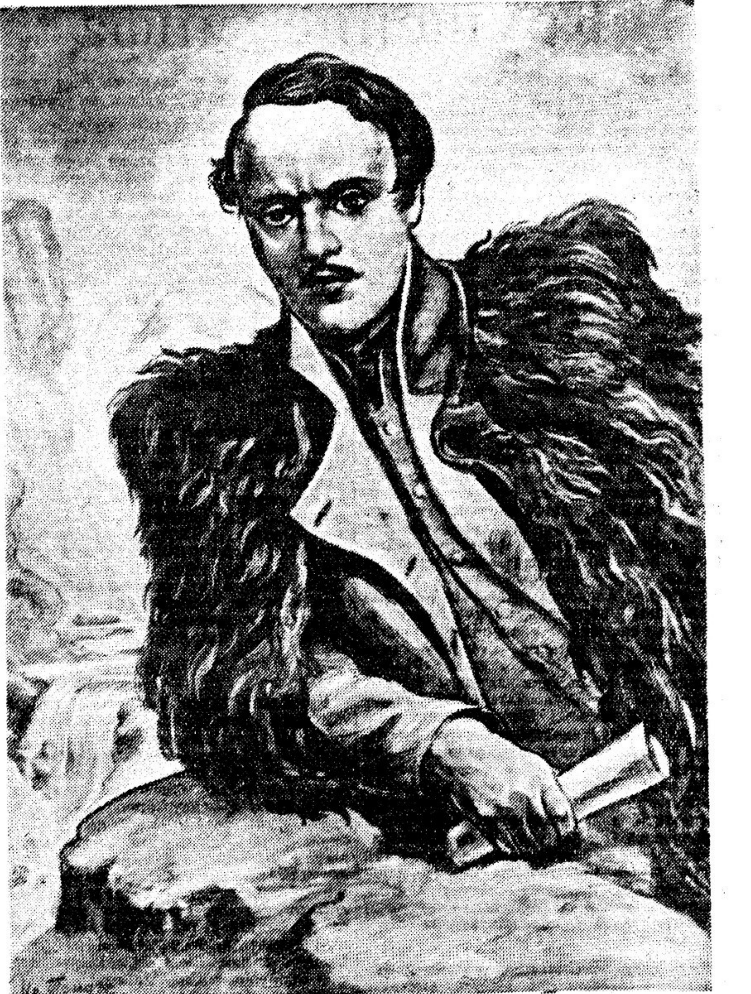
М. Ю. ЛЕРМОНТОВ Сто лет со дня смерти.

От имени профессиональных союзов и всех трудящихся Советского Союза перед рабочему классу и всему народу Великобритании искренний братский привет и пожелания лучших успехов во имя нашей совместной борьбы против злейшего врага — германского фашизма.